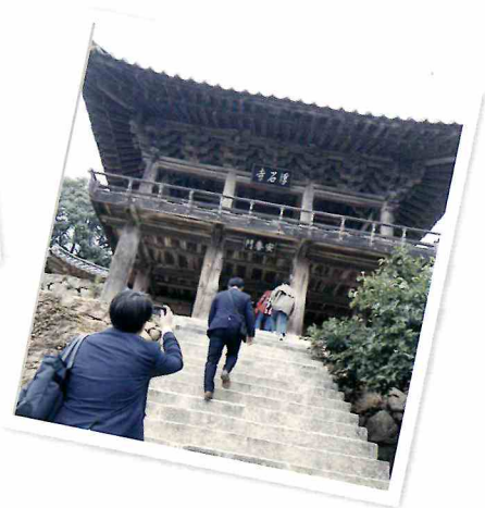
世界遺産 紹修書院と浮石寺を訪問。