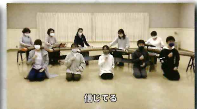
山田流箏曲 藤の会