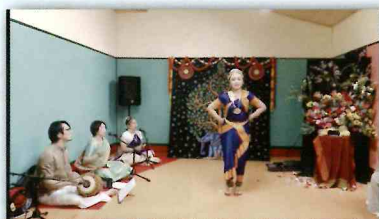
インド舞踊の会サランガイさん