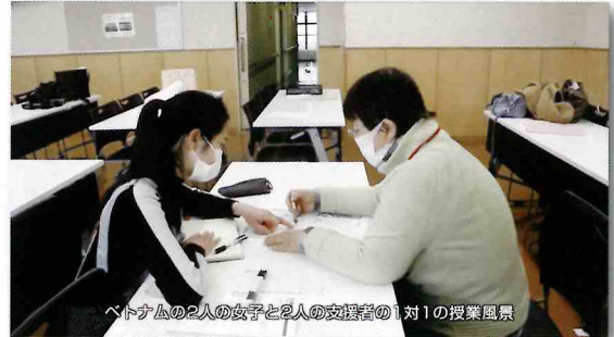
ベトナムの2人の女子と2人の支援者の1対1の授業風景