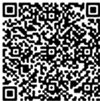
QR apertura del agua

Las modificaciones efectuadas sobre el suministro de agua como: Apertura, finalización de uso o cambio de nombre del usuario debe ser comunicado obligatoriamente al Municipio. Para agilizar los trámites es conveniente que informe el número determinado de la llave de agua. Asimismo le informamos que el trámite de apertura o cese del suministro puede ser efectuado vía telefónica, a través de la página Web (HP) de la Municipalidad de Fujinomiya o la Consultoría para extranjeros.