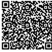
QR para finalizar el uso del agua